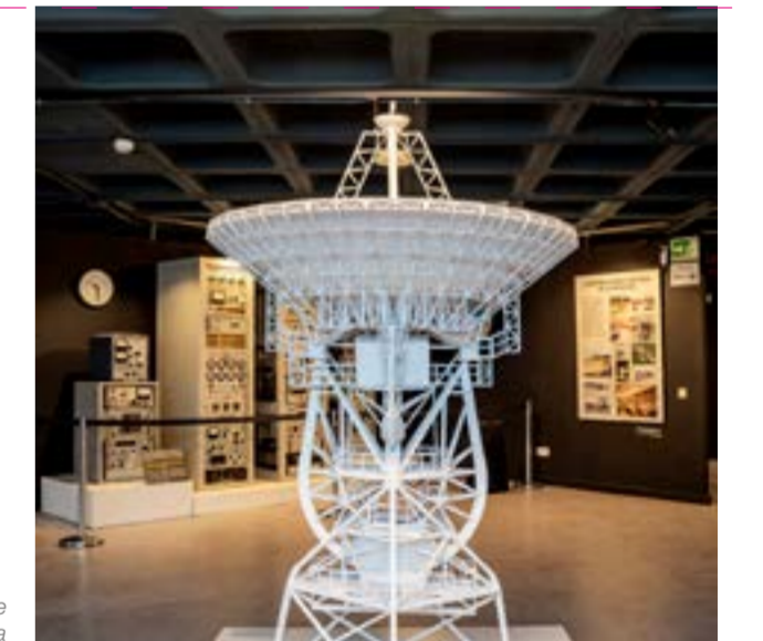
Museo Lunar de Fresnedillas de la Oliva

escuchar las palabras de Neil Armstrong cuando dio el primer paso sobre la luna. Hoy alberga el Museo Lunar. Muy cerca encontramos el centro de comunicación espacial : la Madrid Deep Space Communications Complex de la NASA en Robledo de Chavela, equipada con grandes antenas que permiten la comunicación con el espacio profundo para el seguimiento de satélites.