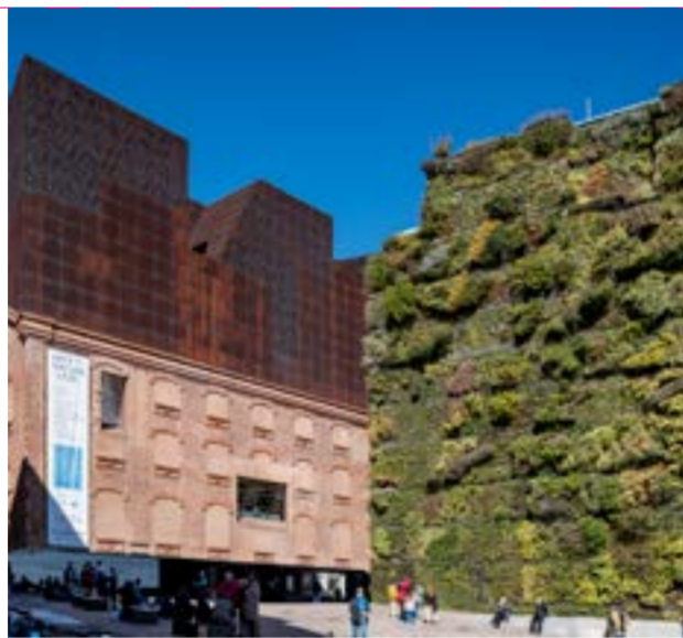
Central Hidroeléctrica de Mediodía, actual Caixaforum

Las pequeñas centrales dentro de la ciudad quedaron en desuso pero fueron recuperadas para la vida de la ciudad. Es el caso de la creación del Caixaforum en la Central de