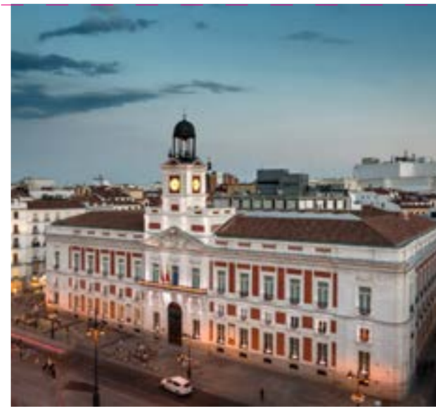
Real Casa de Correos en la Puerta del Sol de Madrid. Actual sede de la Presidencia de la Comunidad

las primeras décadas del s. XIX. El que es hoy sede del Ayuntamiento de Madrid, y uno de los edificios más emblemáticos de la ciudad, el Palacio de Correos y Telégrafos, fue llamado la "Catedral de las comunicaciones" y prestó servicio de correos y telégrafos durante todo el siglo XX. Aquí encontrarás información turística, restaurantes, terrazas con vistas panorámicas a la ciudad y el espacio cultural Centrocentro.