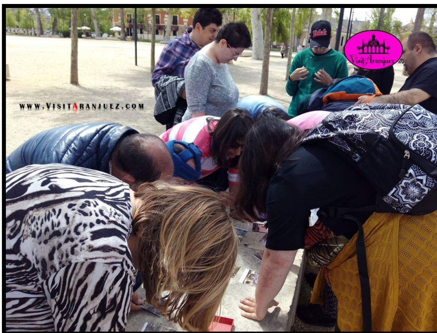
Ilustración 4 Ejemplo de visita guiada de VisitAranjuez para personas con discapacidad.