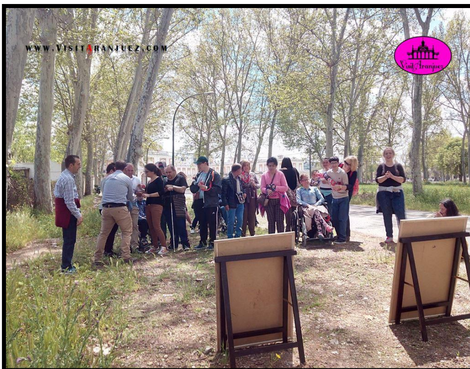
Ilustración 2 Ejemplo de visita guiada de VisitAranjuez para personas con discapacidad.