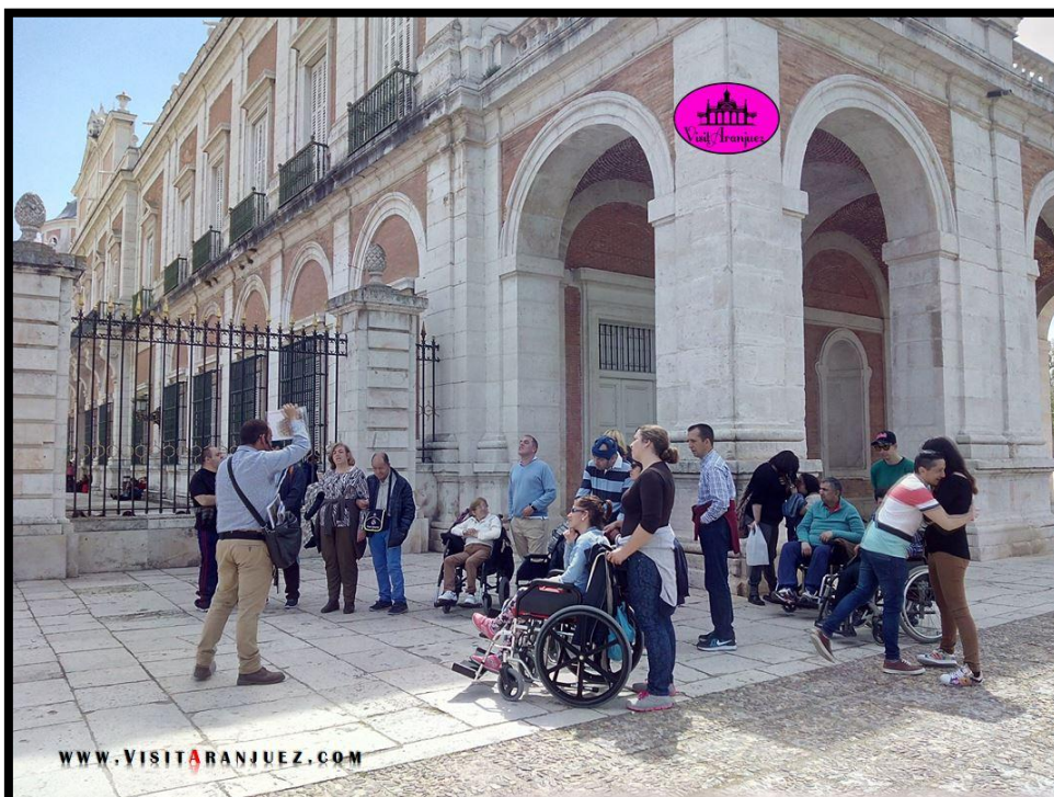
Ilustración 1 Ejemplo de visita guiada de VisitAranjuez para personas con discapacidad.

Se pueden contratar visitas guiadas y visitas adaptadas para personas con discapacidad. Es necesario concertar cita previa para grupos con la empresa “VisitAranjuez” (699649510 – info@visitaranjuez.com – www.visitaranjuez.com )