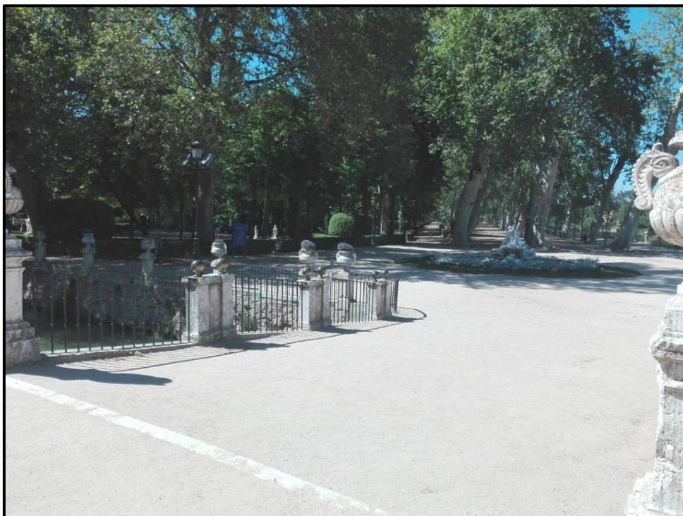
Ilustración 7 - Jardín de la Isla entrada accesible