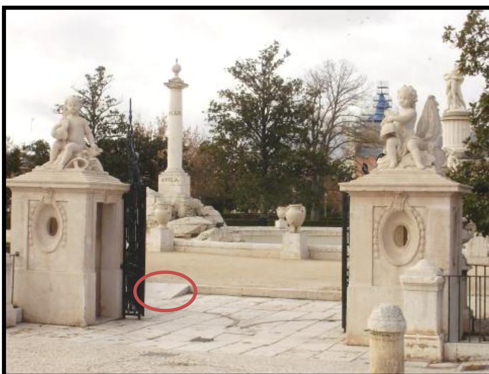
Ilustración 5 - Jardín del Parterre