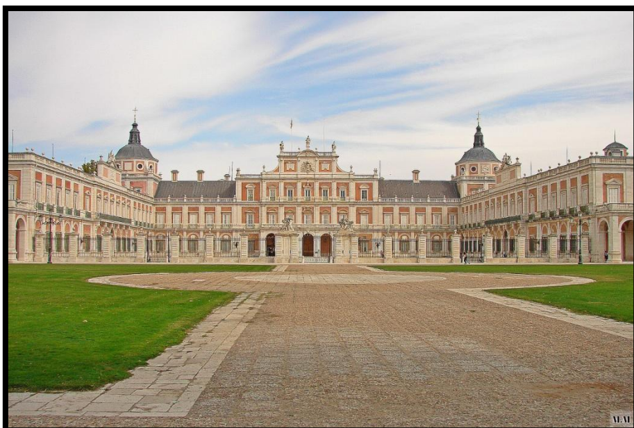
Ilustración 6 - Palacio Real y Plaza Elíptica