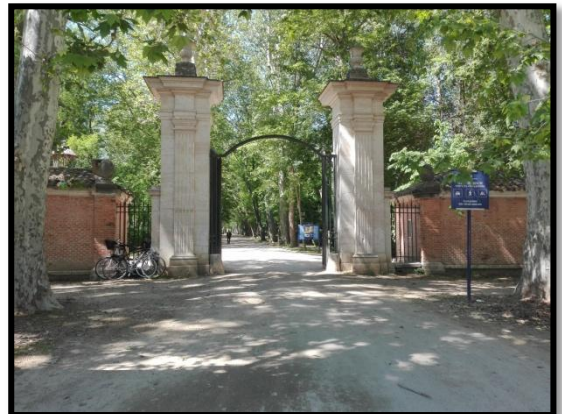
Ilustración 6 - Entradas Jardín del Príncipe