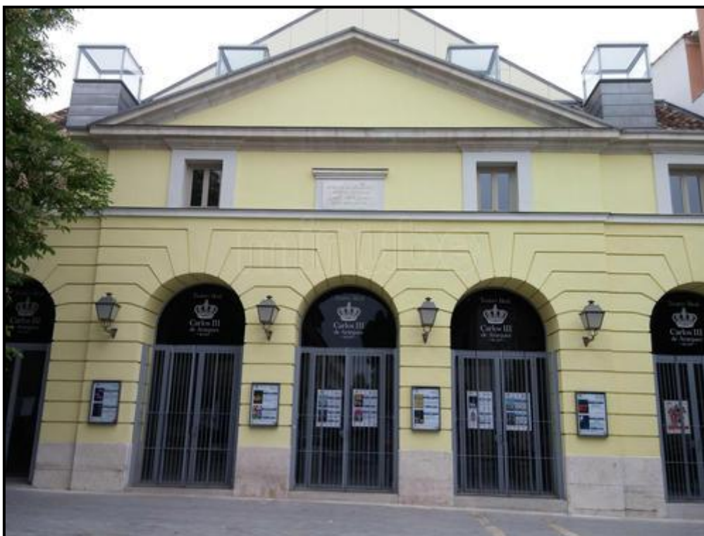
Ilustración 8 - Teatro Real Carlos III