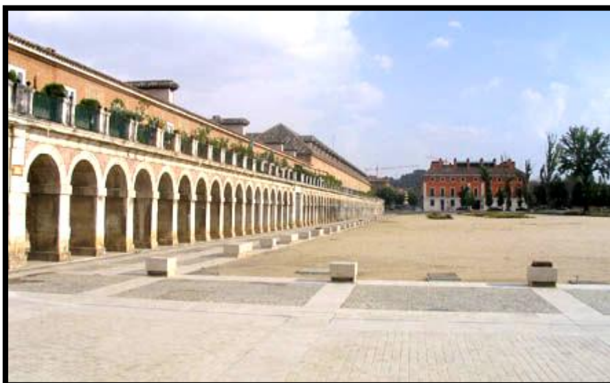
Ilustración 5 - Plaza parejas

A continuación, se muestra la accesibilidad disponible en algunos de los puntos de las rutas.