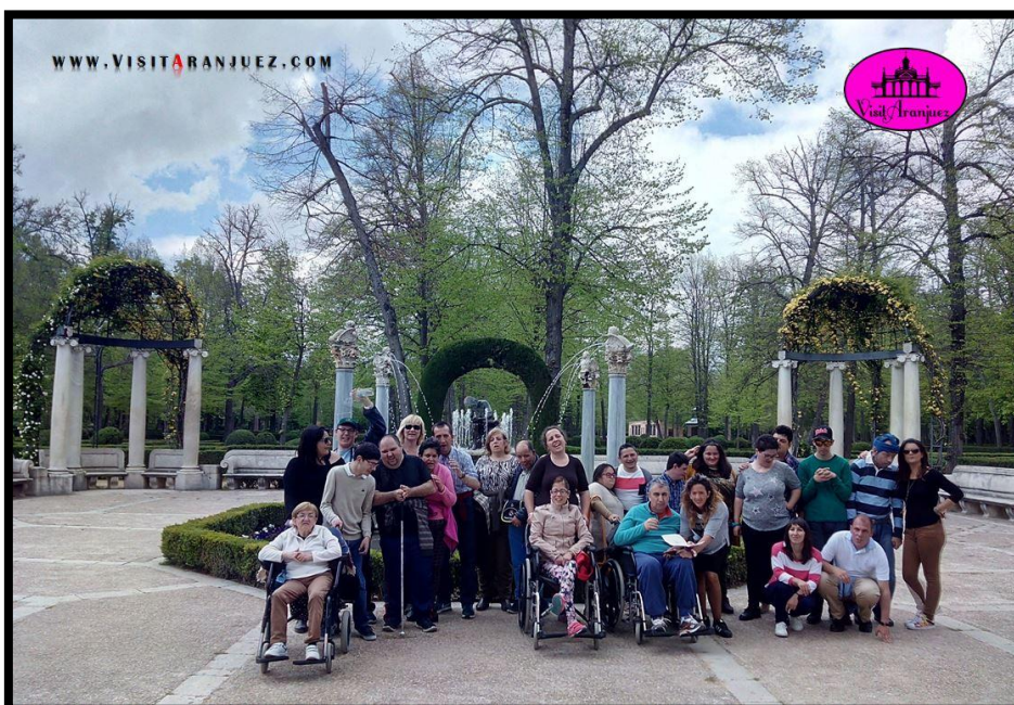
Ilustración 3 Ejemplo de visita guiada de VisitAranjuez para personas con discapacidad.