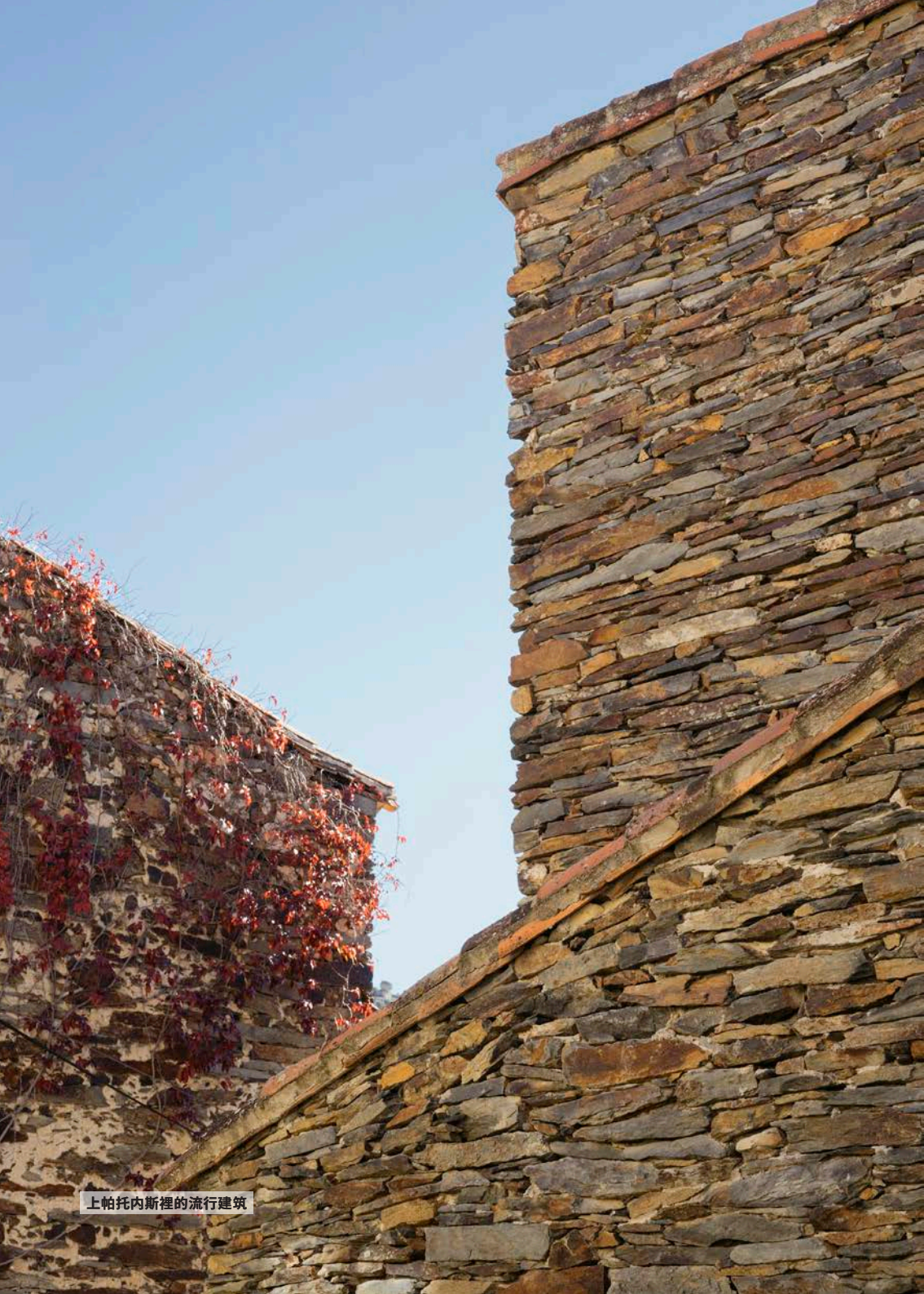
上帕托内斯裡的流行建筑