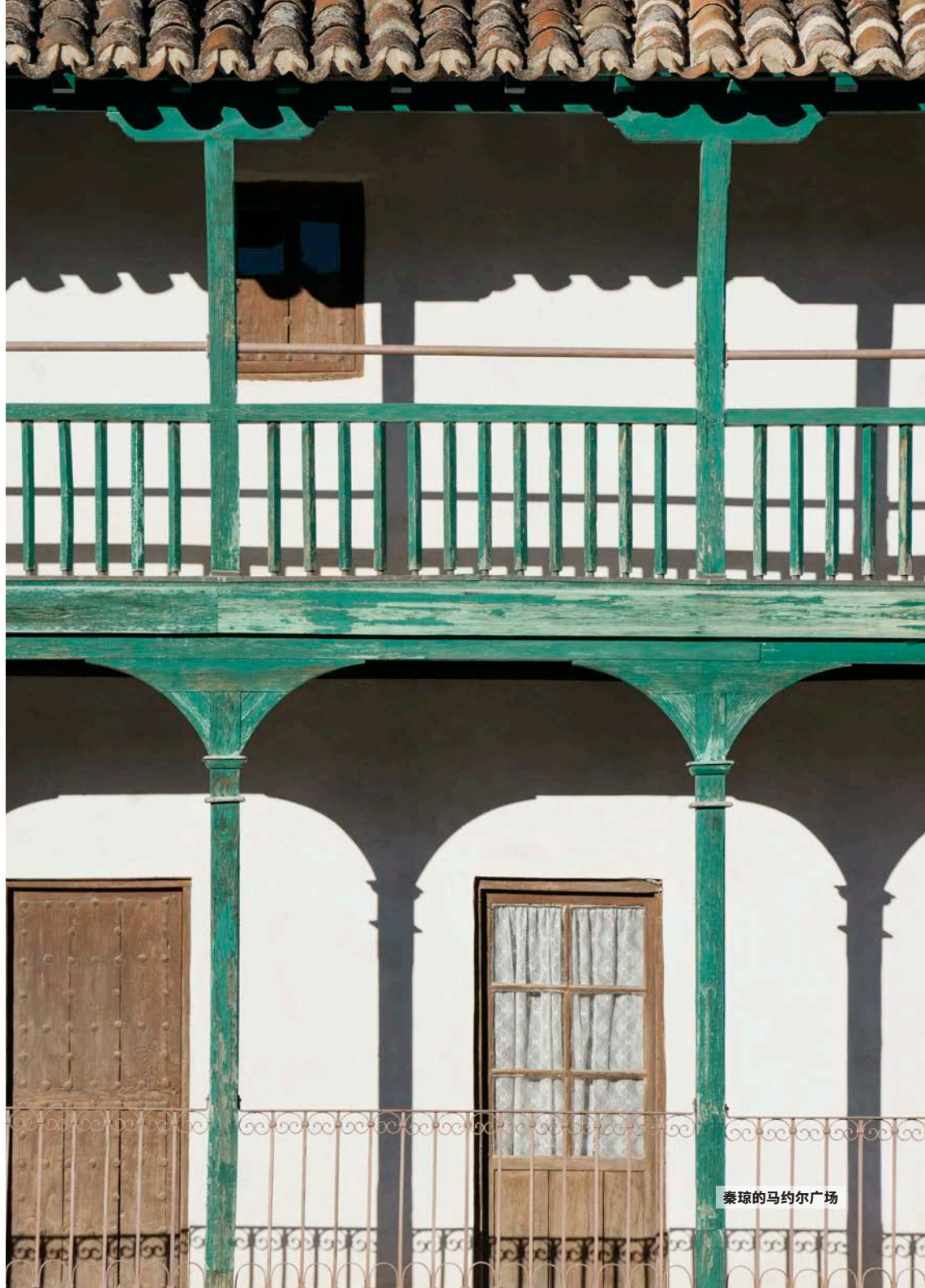
秦琼的马约尔广场

只有逛过这些美食市场、品尝小吃摊制作或创新的美食，顺便品尝一杯葡萄美酒、啤酒或鸡尾酒，好好享受一下当下的气氛，就像一个马德里本地人一样，你的马德里之旅才算真正圆满了。