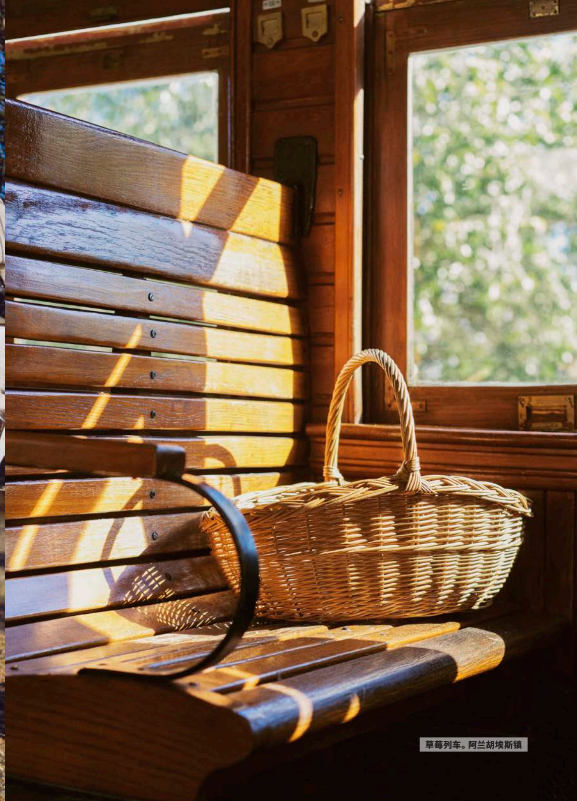
草莓列车。阿兰胡埃斯镇