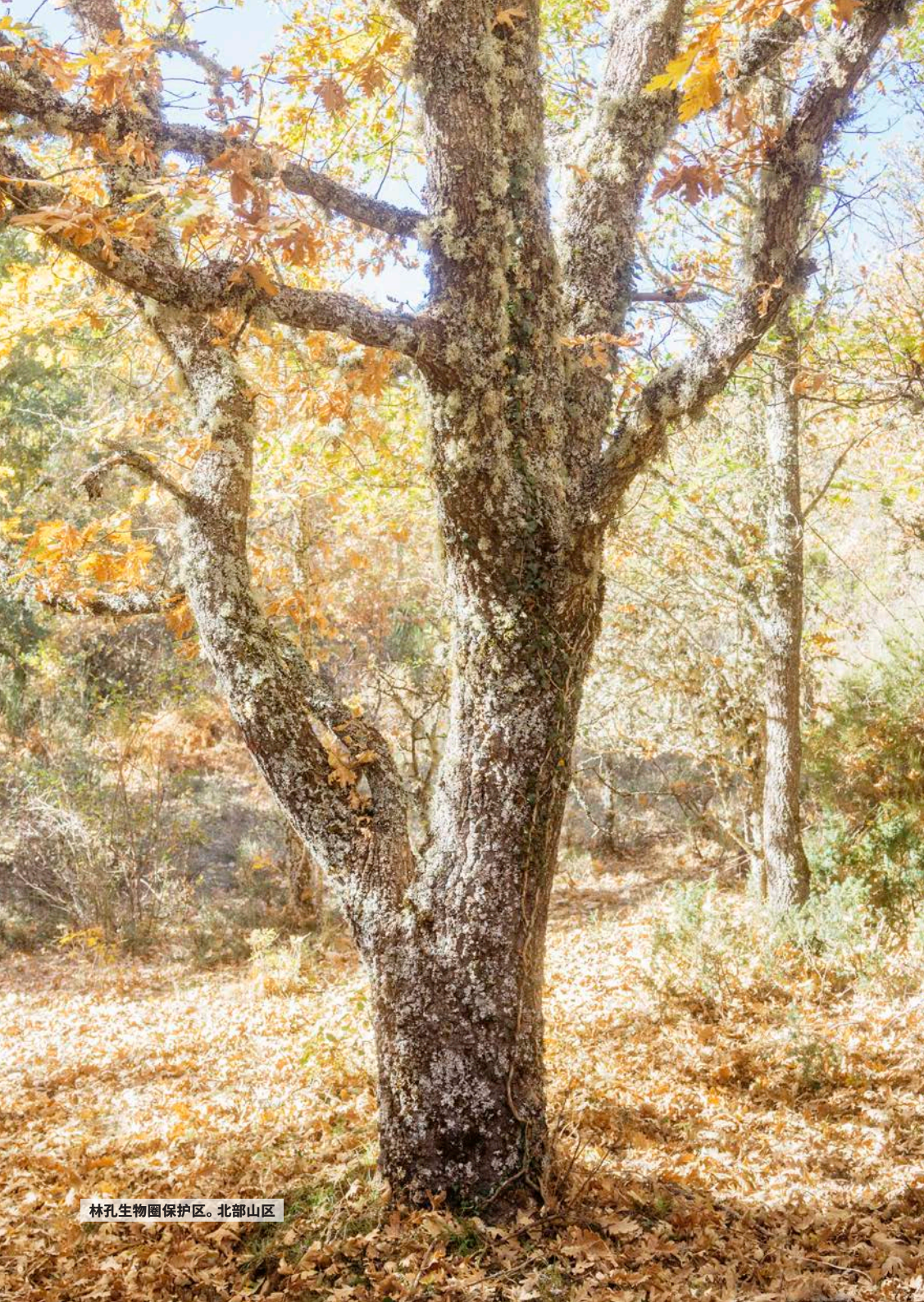
林孔生物圈保护区。北部山区