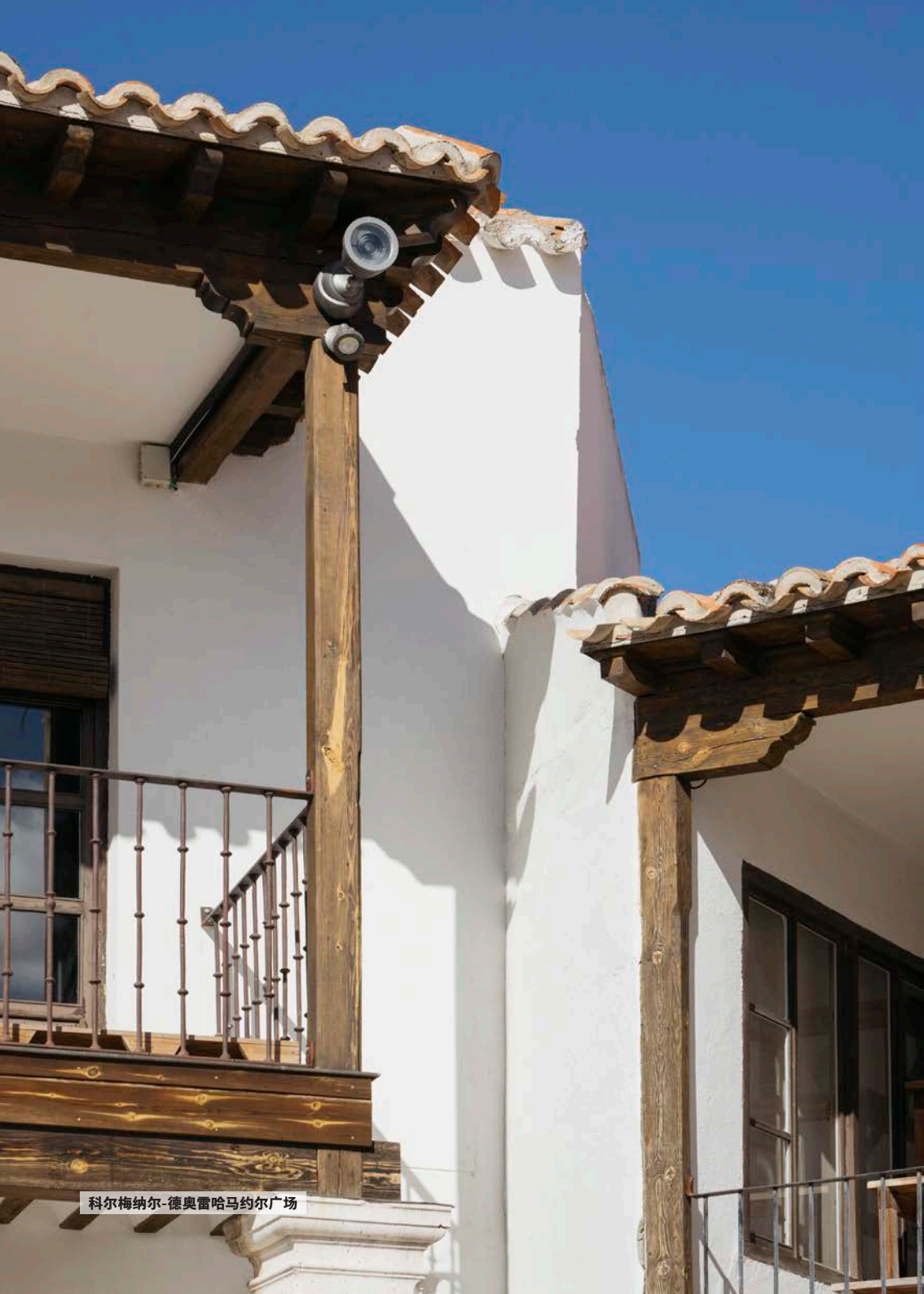
科尔梅纳尔-德奥雷哈马约尔广场