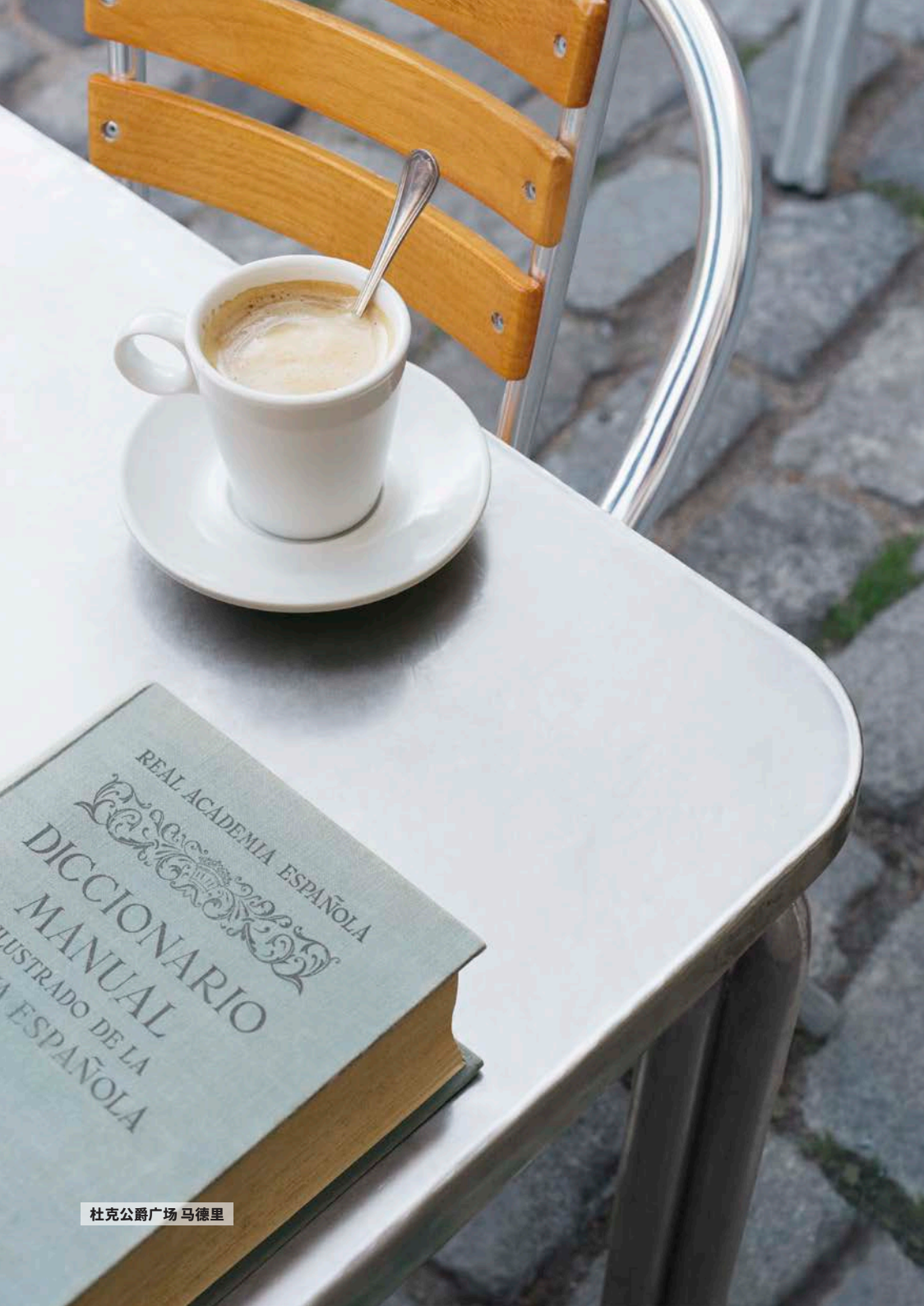
杜克公爵广场 马德里