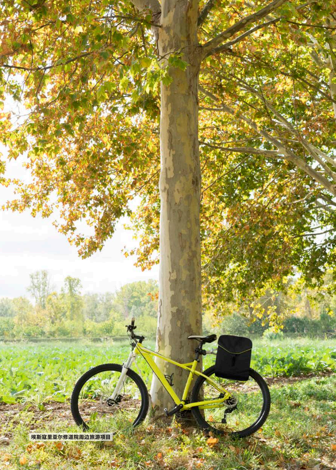
埃斯寇里亚尔修道院周边旅游项目