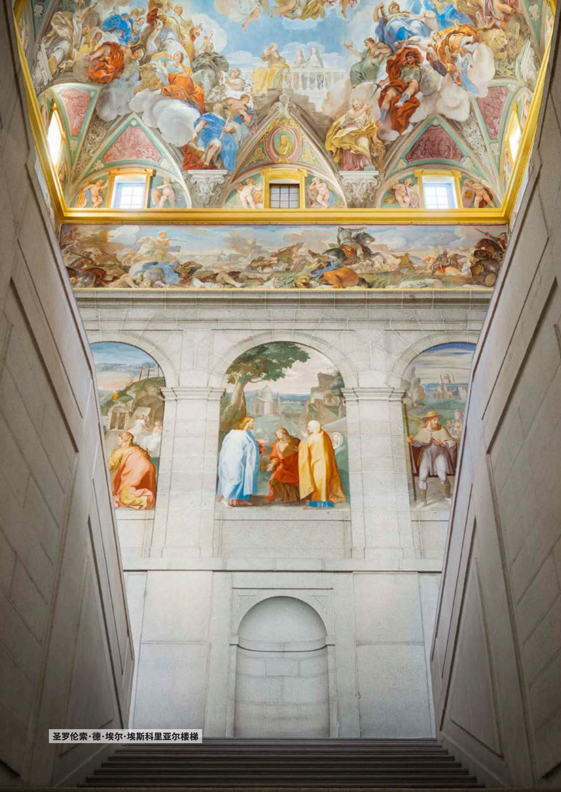
圣罗伦索·德·埃尔·埃斯科里亚尔楼梯