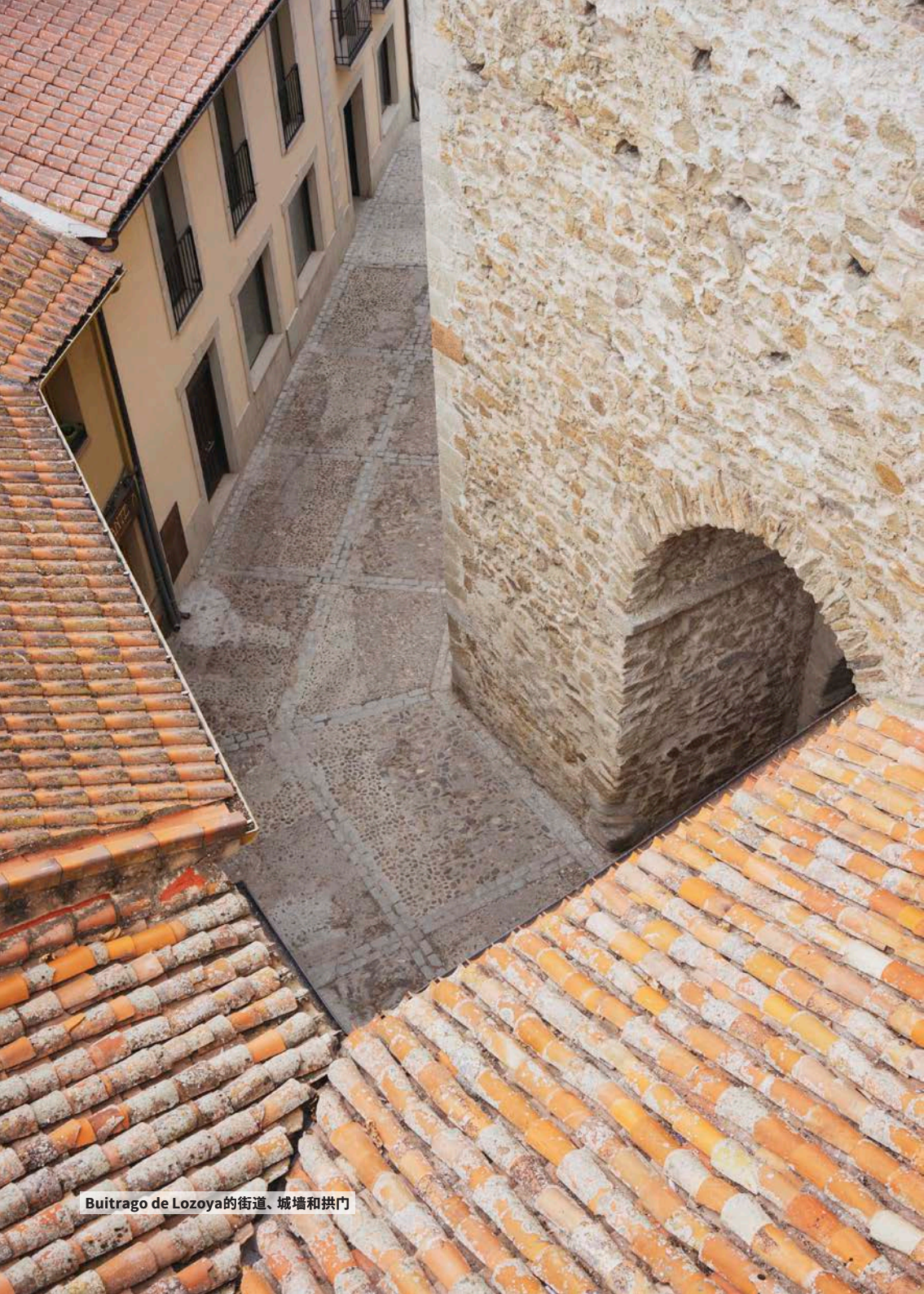
Buitrago de Lozoya的街道、城墙和拱门