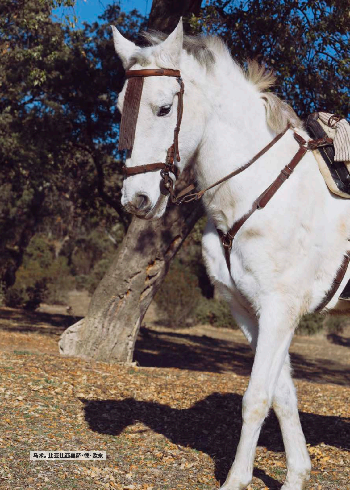
马术。比亚比西奥萨·德·欧东